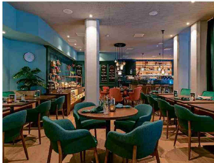
«Schweizerhof Bar Restaurant» in Lenzerheide.