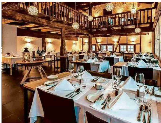
Gourmetrestaurant «Guarda Val» in Lenzerheide-Sporz.

Referenz: 70290521 Ausschnitt Seite: 1/2