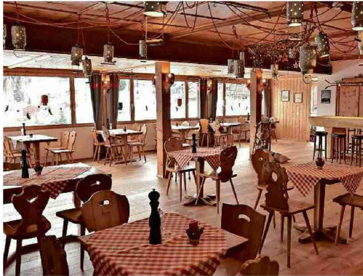
«z'Gürgaletsch» in Tschierschen.

Referenz: 70290521 Ausschnitt Seite: 2/2